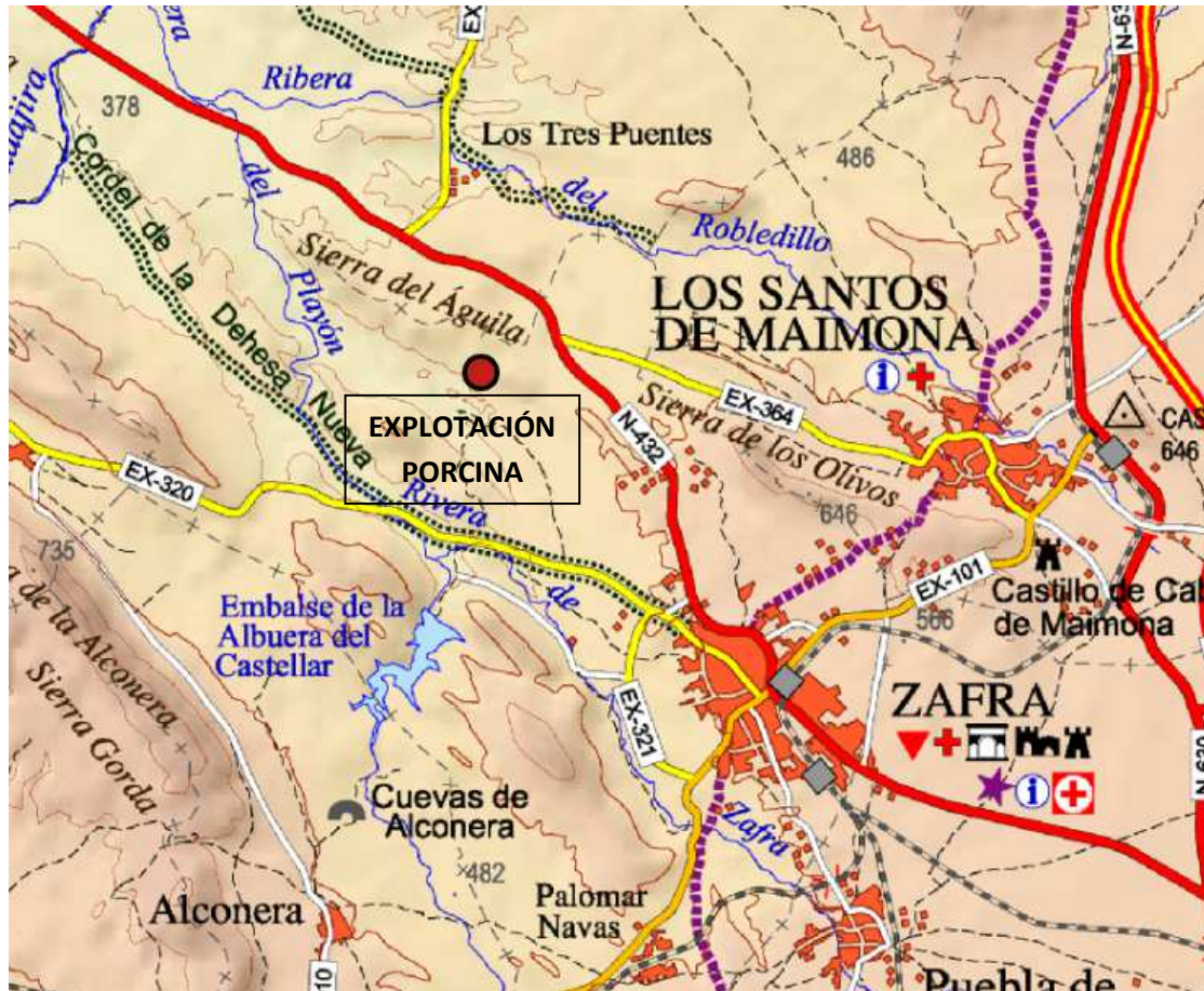
Imagen 1.- Emplazamiento de la Explotación Porcina.

INTELECTUAL COMPANY- DEPARTAMENTO MEDIOAMBIENTAL